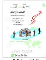
اللبنانيون في العالم The Lebanese over the World 2019