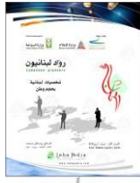
رواد لبنانيون Lebanese Pioneers 2018