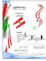
انت لبناني شجع اللبناني Lebanese Pioneers 2018