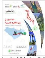
اللبنانيون في دول الخليج العربية The Lebanese In Arab Gulf Countries 2019