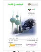
اللبنانيون في الكويت The Lebanese in Kuwait 2012