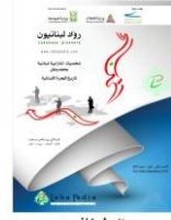
رواد لبنانيون Lebanese Pioneers 2016