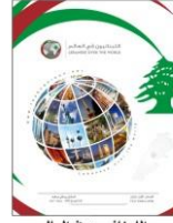
اللبنانيون في العالم The Lebanese over the World 2014