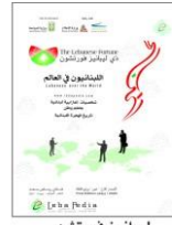
ليبانيز فورتن Lebanese Fortune 2020