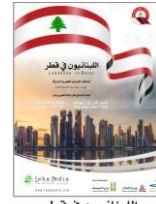
اللبنانيون في قطر The Lebanese in Qatar 2020