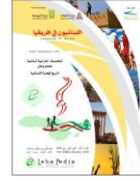
اللبنانيون في افريقيا The Lebanese in Africa 2017

في الفصل الأخير من العام 2021 قمنا بخطوة نوعية استكمالاً لمشروعنا وتماشياً مع احتياجات العصر، تمثلت بعملية دمج كافة أعمالنا السابقة والمستقبلية ضمن "مجموعة ليا بيديا الثقافية" التي تضم: