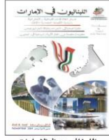
اللبنانيون في الإمارات The Lebanese UAE 2008